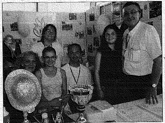
Les nouvelles majorettes de Chambly avaient leur stand !

latélie, généalogie, école de musique. Le forum a démontré que le panel associatif camblysiens permettait à tous, enfants et adultes, de trouver dans la ville, l'association qui leur permettrait de s'épanouir.