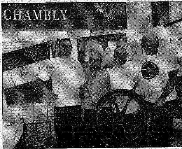
Les Anciens Marins de Chambly avaient réalisé un sacré décor !

Rares sont les villes qui possèdent un tissu associatif aussi important. Les visiteurs ont pu s'en rendre compte samedi.